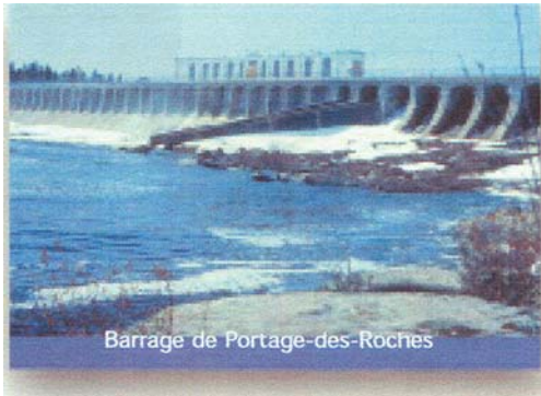
Barrage de Portage-des-Roches

Lorsque l'analyse de la situation démontre que des