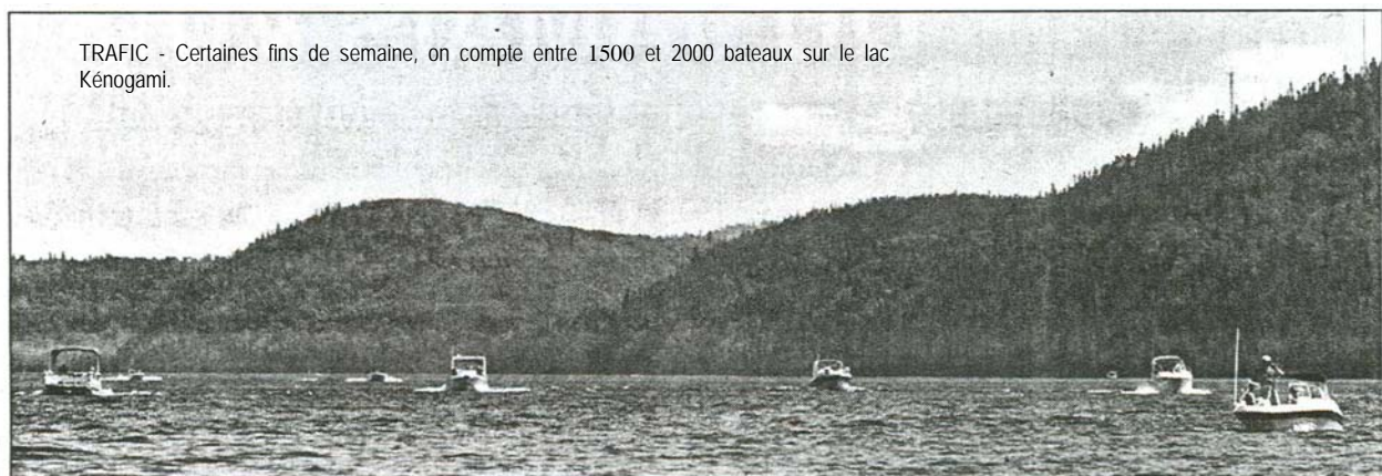
TRAFIC - Certaines fins de semaine, on compte entre 1500 et 2000 bateaux sur le lac Kénogami.

«La fin de semaine on compte pas moins de 1500 à 2000 bateaux, sur le lac Kénogami. "Ça commence à faire du trafic", lance celui qui ne voit pas de ralentissement de cette activité, malgré la hausse du coût de l'essence. «Les gens vont brûler jusqu'à 200 $ d'essence la fin de semaine sans dire un mot car c'est une activité de loisir», soutient le vendeur d'essence qui se réjouit de la vague de beau temps qui s'abat sur la région depuis le début de l'été.